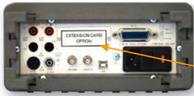
Внешний вид задней панели (B7-78/1)

Интерфейс GPIB (КОП) или RS-232, 10 кан./ 20 кан. сканер для B7-78/1